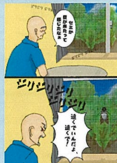
1頁漫畫【高中組】(Distance·距離) 作品名:夏天的距離感 筆名:NATATEKOKO