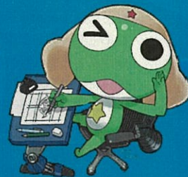
應援角色 Keroro軍曹