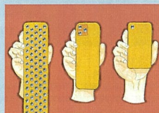
1頁漫畫【一般組】(成果·距離) 作品名:智能手機的終結 筆名:KOUTA的頻道